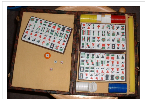
Mah jonggová souprava

Navzdory různým legendám se jedná o poměrně novou hru. První informace o ní pocházejí z roku 1880 a největšího rozmachu dosáhla kolem roku 1920. Ovšem i tato hra má své mnohem starší karetní předky. Jedná se o hru určenou pro 4 hráče (která se podobá karetní hře kanasta), i když většina lidí ji má díky čítným počítačovým hrám zafixovanou jako hru pro jednoho hráče, tzv. solitér.